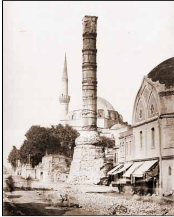
Tramvay yolu açılırken Çemberlitaş'ın ve Çemberlitaş Hamamı'nın görünümü.

"... evveleminde şunu arz edeyim ki, kıymet-i târihiyye ve sînâ'iyenin azı çoğu olmaz. Bir eserin ya kıymet-i târihiyye ve sînâ'iyyesi vardır veyâhud yokdur. ... bu gibi âsâra, vesâ'ik-i târihiyyeye sözde hürmet lüzumunu tasdîk etmekle beraber tramvay için dört arşunluk yol feda etmek cihetine gidilecek olursa ahlâf için hürmet edebilecek âsâr-ı mezkûre yerine Avrupa fabrikalarından para ile satın aldığımız elektrik tramvaylarının demiryolları kalacaktır..... acaba âsâr-ı mezkûreyi muhafaza etmek şartıyla bir tramvay yolu veya yol açmak niçün mümkün değildir? Avrupa'nın eski binaları ve dar yolları olan ve kıymet-i târihiyyeyi hâ'iz bulunan şehirlende nasıl her tarafı elektrik tramvayı nakliyâtıyla te'mîn etmişlerdir?..... tertîb olunan projelerinin tatbikinde, dün bir türbe, bu gün bir medrese, yârin bir sebîl ortadan kalkmaktadır. .... Tramvay yolu İstanbul'da ne acıklı tahribat yapmıştır! Ne mühim eserleri tahrîb etmiştir! Bunlar tedkik edildikçe ve o eserlerin ilelebed