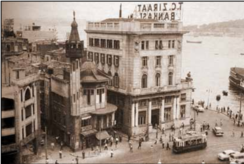
Karaköy Camii'nin yıkılmadan önceki diğer bir görünümü.

zamanında yapılmış bir tekke bulunuyordu. Tekke zamanla harab olunca, 17. asırda yerine, Merzifonlu Kara Mustafa Paşa tarafından bir mescit inşa edildi. Karaköy Camii olarak bilinen mescidin asıl adı Merzifonlu Kara Mustafa Paşa Camii'dir. Zamanla bu caminin de harap olması üzerine, 1893'te İstanbul'a gelen ve daha sonra saray başmimarı olan İtalyan mimar Raimondo D'Aronco'dan aynı alana yeni bir cami inşa etmesi istendi. Mimar D'Aronco 1903'te, Sultan II. Abdülhamid'in emriyle, O zamanlarda moda olan ve İstanbul'da pek çok örneği bulunan "Yeni Sanat" tarzında bir cami inşa etti.