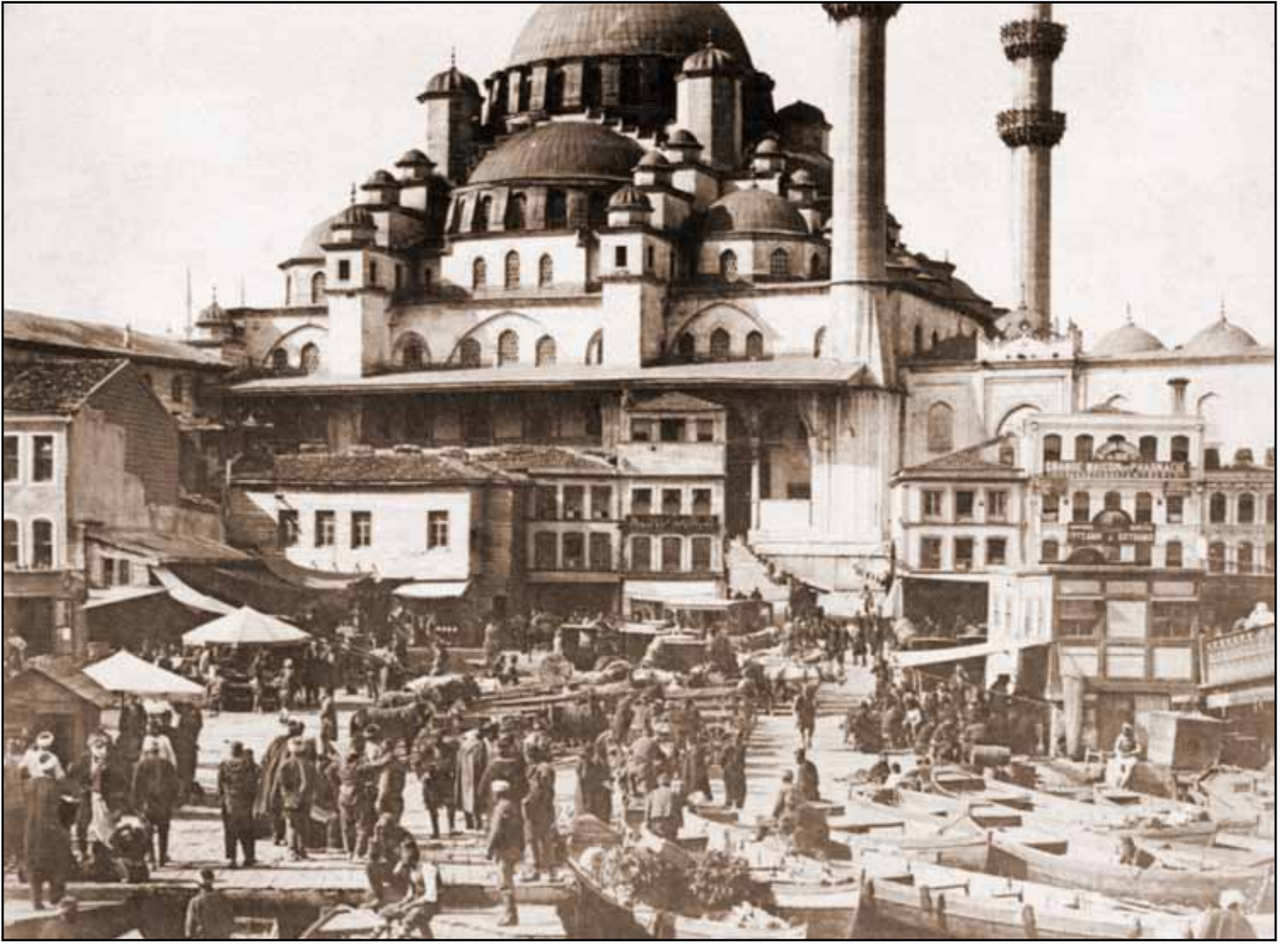
Eminönü ve Yeni Camii'nin 1800'lerdeki durumu.

1880